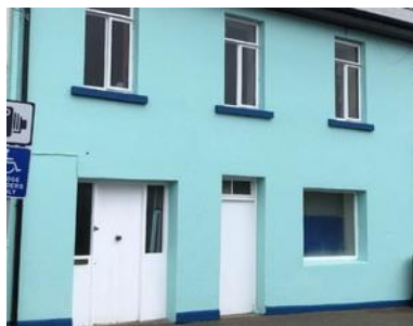
Scéim Feabhsaithe Sráid-dreacha 2021 in Uachtar Ard