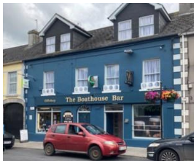
Scéim Feabhsaithe Sráid-dreacha 2023-24 i bPort Omna